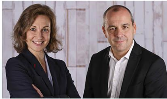
Marylise Léon Secrétaire Générale CFDT

« Notre syndicalisme fait le pari de la force de la proximité, de la pertinence des propositions, de la confrontation des idées, de la négociation et, lorsque c'est nécessaire, de la force du nombre. »