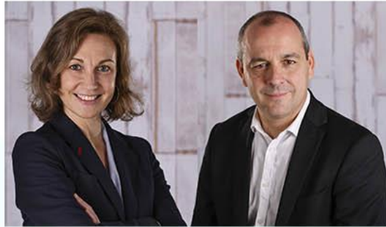
Marylise Léon Secrétaire Générale CFDT

« Notre syndicalisme fait le pari de la force de la proximité, de la pertinence des propositions, de la confrontation des idées, de la négociation et, lorsque c'est nécessaire, de la force du nombre. »