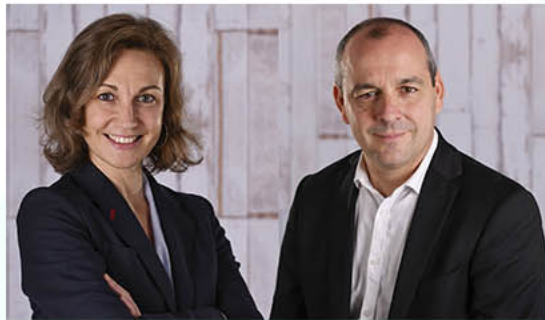
Marylise Léon Secrétaire Générale CFDT

« Notre syndicalisme fait le pari de la force de la proximité, de la pertinence des propositions, de la confrontation des idées, de la négociation et, lorsque c'est nécessaire, de la force du nombre. »